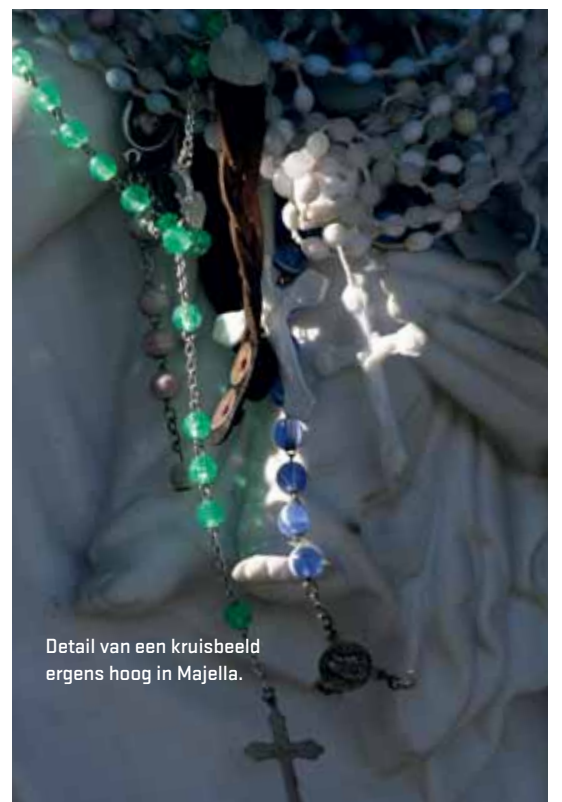
Detail van een kruisbeeld ergens hoog in Majella.