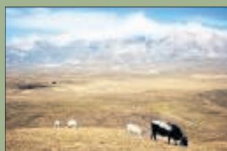
Grazige weide: De hoogvlakte is een filmdecor.