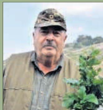
Stroper: Een plaatselijke boer plukt wilde spinazie.