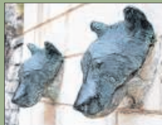
Koppig: De Marsicaanse beer heeft pluizige oortjes.