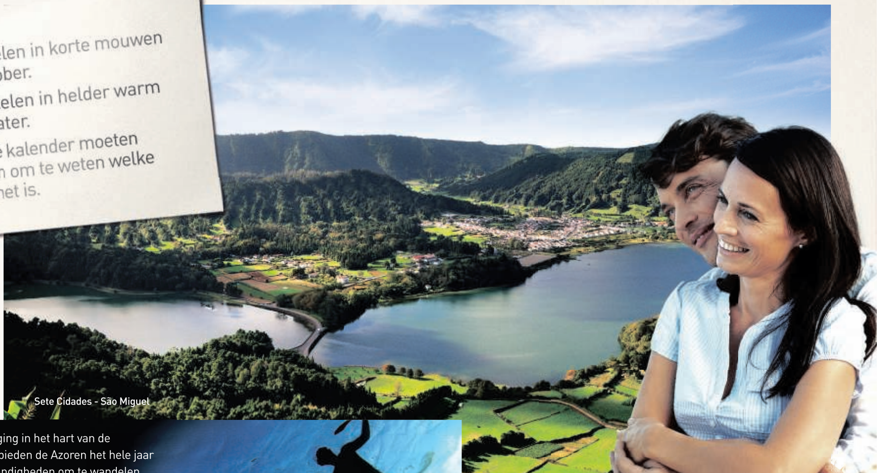
Sete Cidades - São Miguel

Door hun unieke ligging in het hart van de Atlantische Oceaan bieden de Azoren het hele jaar door de beste omstandigheden om te wandelen, walvissen te spotten, te duiken, golf te spelen, en een unieke natuur en geo-toerisme te ervaren. Ontmoet er een boeiend Werelderfgoed en laat u verleiden door een gastronomie met eigen producten uit de archipel. Azoren. Een levendige bestemming, magisch en veilig waar de dagen nooit dezelfde zijn.