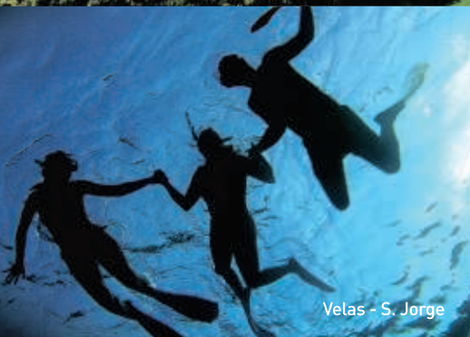
Velas - S. Jorge

Door hun unieke ligging in het hart van de Atlantische Oceaan bieden de Azoren het hele jaar door de beste omstandigheden om te wandelen, walvissen te spotten, te duiken, golf te spelen, en een unieke natuur en geo-toerisme te ervaren. Ontmoet er een boeiend Werelderfgoed en laat u verleiden door een gastronomie met eigen producten uit de archipel. Azoren. Een levendige bestemming, magisch en veilig waar de dagen nooit dezelfde zijn.