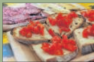
Eerlijk: Een eenvoudige maaltijd van lokale producten.