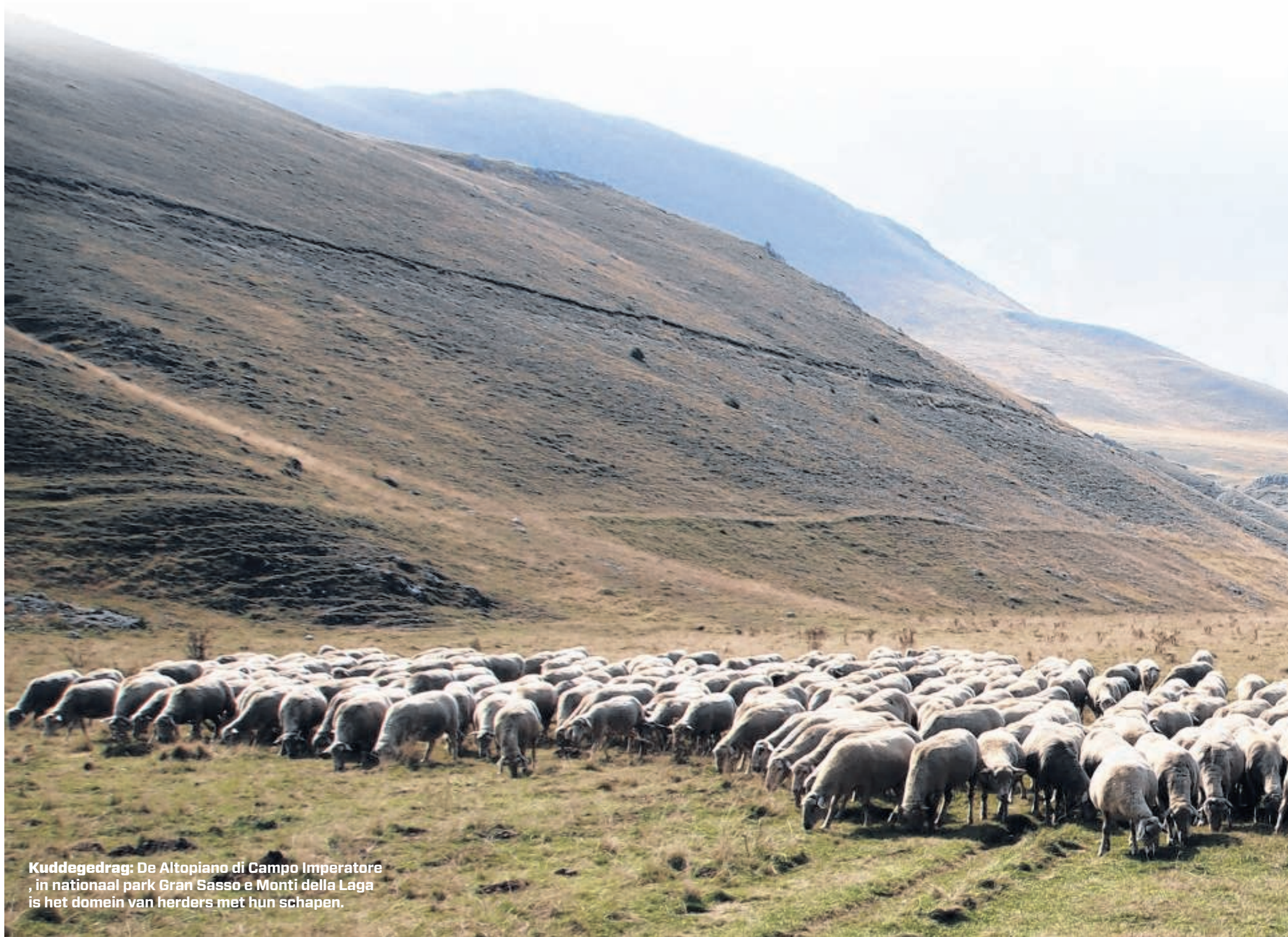
Kuddegedrag: De Altopiano di Campo Imperatore, in nationaal park Gran Sasso e Monti della Laga is het domein van herders met hun schapen.