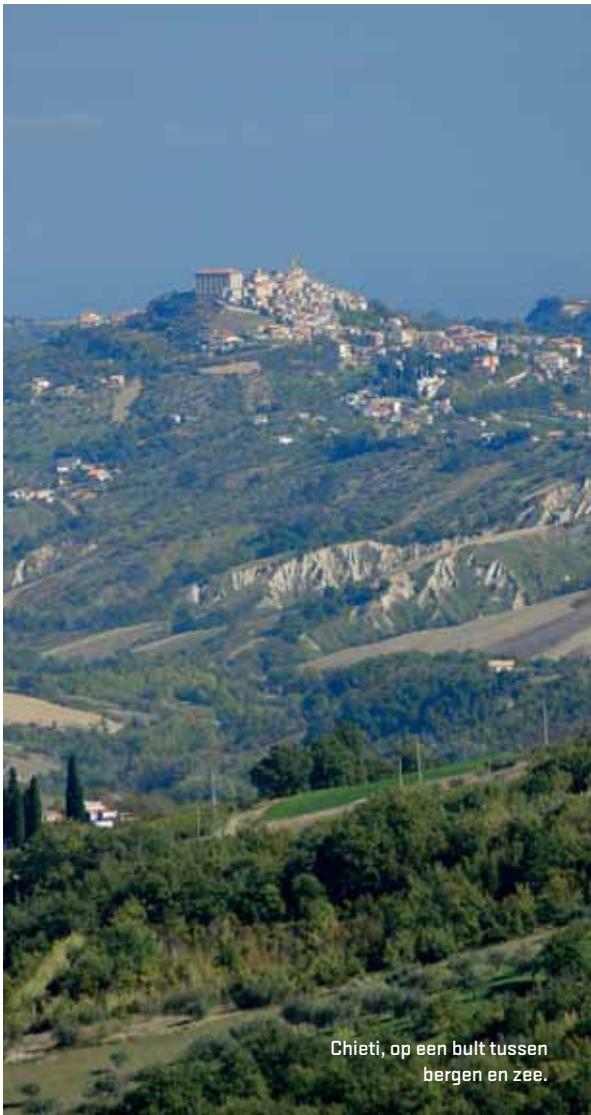
Chieti, op een bult tussen bergen en zee.