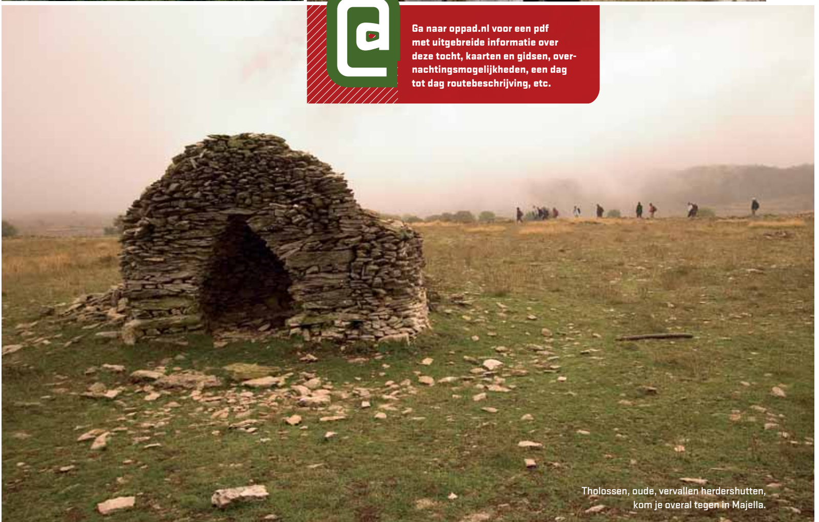
Tholossen, oude, vervallen herdershutten, kom je overal tegen in Majella.

Ga naar oppad.nl voor een pdf met uitgebreide informatie over deze tocht, kaarten en gidsen, overnachtingsmogelijkheden, een dag tot dag routebeschrijving, etc.