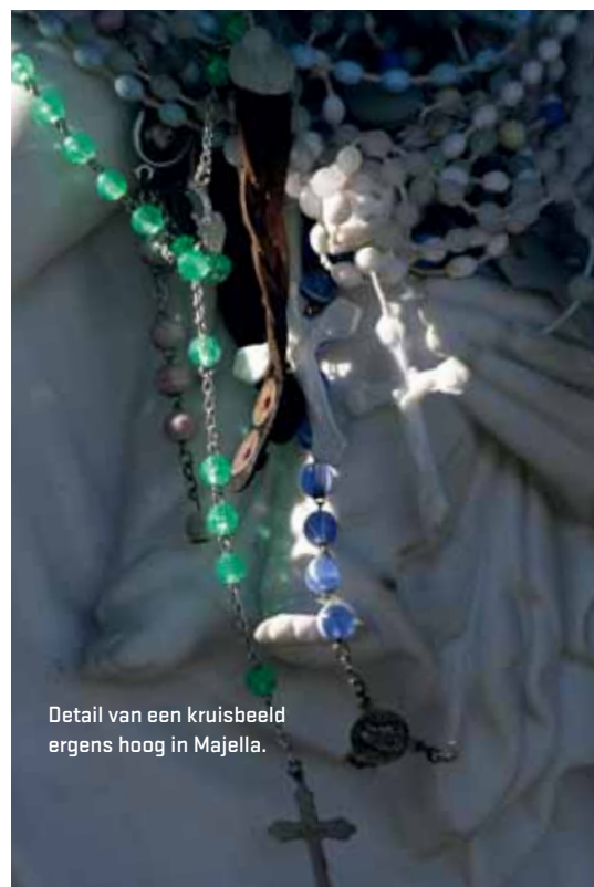
Detail van een kruisbeeld ergens hoog in Majella.